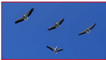
Aves di Roberto Tibaldi panoramico 2,35:1 5'

continua ogni giorno". Sola in mezzo all'Oceano è l'isola delle cascate e delle acque impetuose, dei vulcani attivi e delle gigantesche colate laviche, dei geysir testimoni del suo cuore bollente, che convive con i ghiacciai più estesi d'Europa.