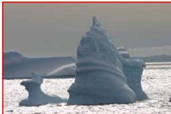
Oltre la fin del Mondo di Roberto Tibaldi panoramico 2,35:1 10'

Un'opera "senza capo nè coda, solo ali".