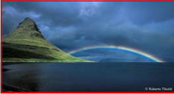
Magica Islanda di Roberto Tibaldi panoramico 2,35:1 26'

"Dio creò il cielo e la terra in sei giorni, poi si riposò. Ma si dimenticò dell'Islanda ... qui infatti la creazione