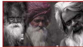
Visage di Roberto Tibaldi panoramico 2,35:1 9'

gne e altipiani, pascoli e foreste, valloni e radure, come lenti vascelli dalle vele porpora, guidano l'uomo verso un miracolo senza fine, verso un avvenire di bellezza e di pace." Questa frase del francese Jean Siccardi ben riassume la vocazione dei due parchi transfrontalieri (Parc National Du Mercantour e Parco Naturale Alpi Marittime) che con questa multivisione festeggiano il loro venticinque anni di vita.